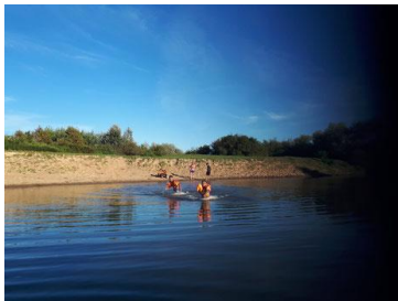
Ausflug zur Tour:

Dieses Mal sprechen Bilder wieder mehr als Worte: